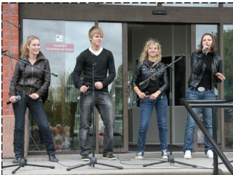
Vieni no aktīvākajiem koncerta dalībniekiem ! :)