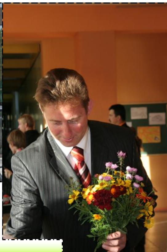
Arī direktors sveic savus skolēnus! :)