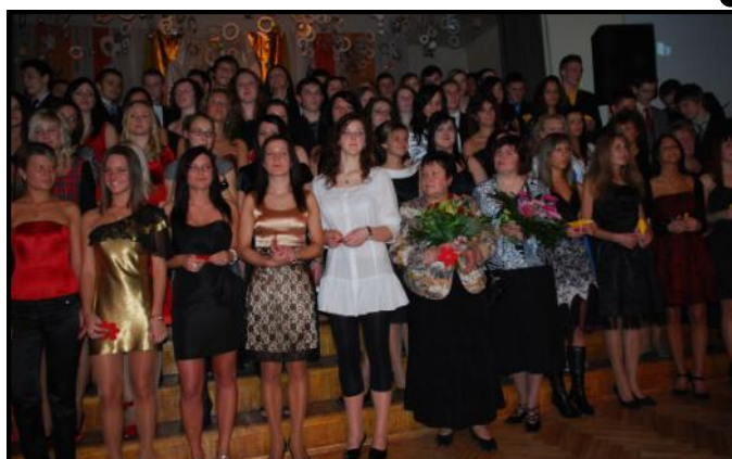
Mūsu skolas divpadsmitie vienā no svarīgākajiem pasākumiem vidusskolēna dzīvē — žetonvakarā. (Raksts 5.lpp.)