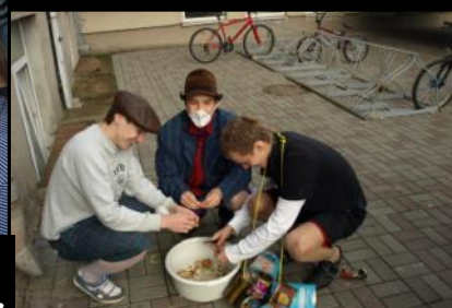
Izsvētības—Lasi 6.,7. lpp.