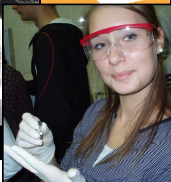
Zinatnieku nakts! 3.lpp.