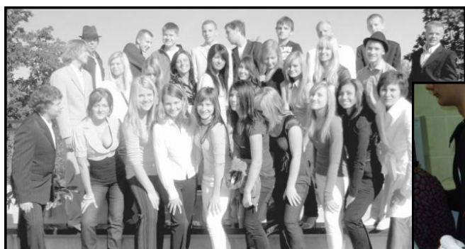
Mūsu jaunie—desmitie! 8.,9.lpp.