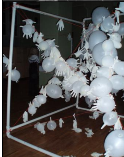
Piepūsto cimdu veidojums LU.